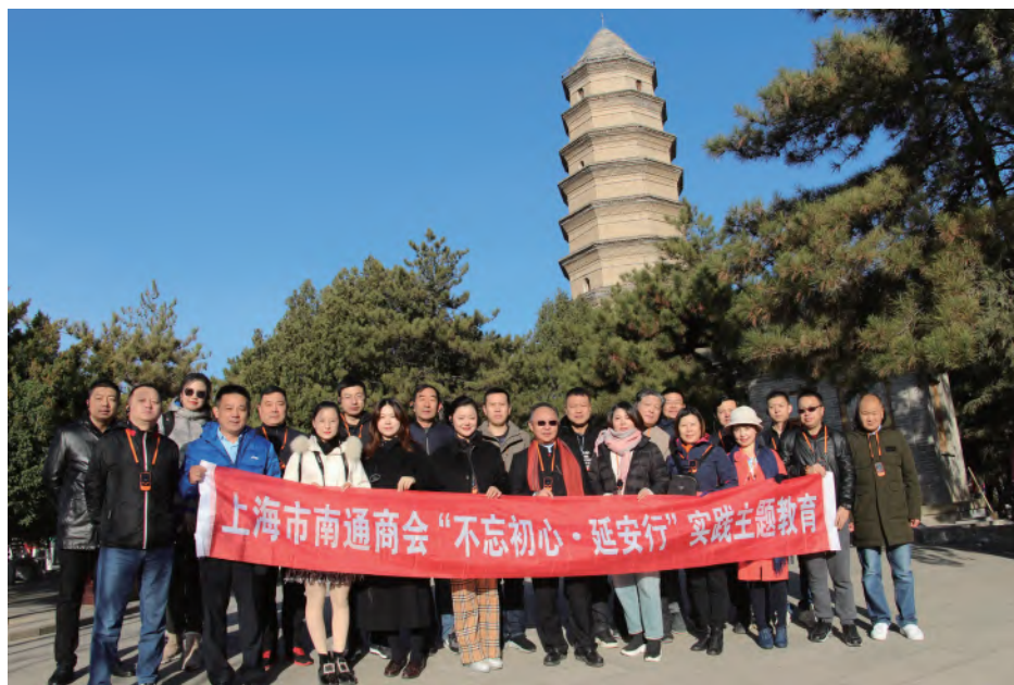
为传承革命精神,坚定理想信念,更好地服务、指引会员单位企业发展。2019年11月14日,上海市