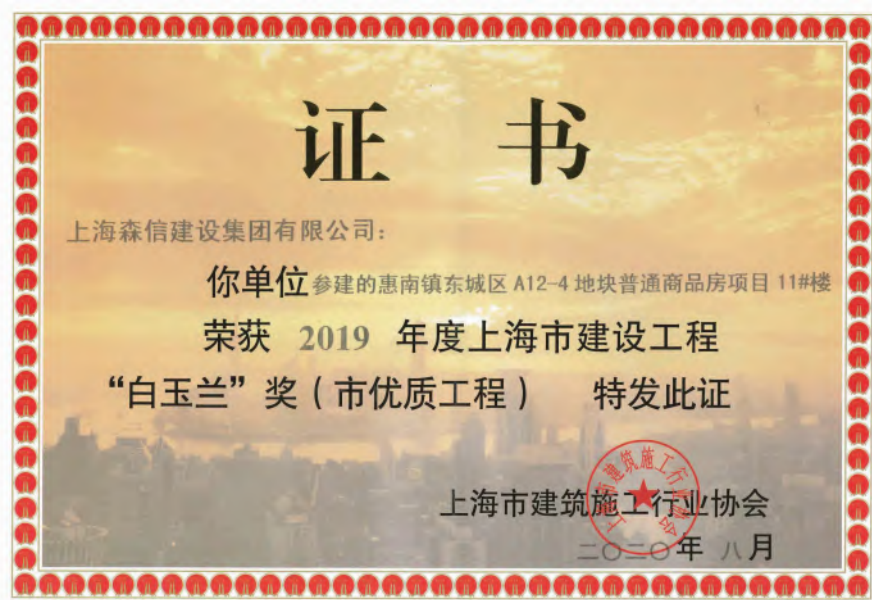
我司建设的惠南镇东城区A12-4地块普通商品房项目11#楼荣获2019年度上海市建设工程“白玉兰”奖(市优质工程)