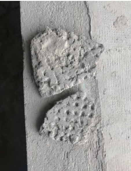
图5，抹灰层与界面剂完全脱开，界面剂与基层粘结牢固

9、气候干燥、风速过快的北方地区，除了在抹灰前一天浇水湿润基层外，抹灰时必须先在基层上用滚筒或毛刷滚刷一道801胶水溶液，配比为801胶：水=1:5，增强抹灰层与基层的粘接剂。同时要提前做好门窗洞口的封闭，确保不因风大，砂浆缺水等原因导致抹灰层空鼓、开裂。图5显示就是因为砂浆上墙时因为墙面基层干燥吸水，导致砂浆水份流失过快，在抹灰层与基层之间产生隔离，粘结不牢，引起空鼓现象。